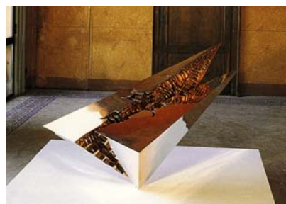
In alto: la scultura Colpo d'ala destinata alla Villa

paese per appassionati e curiosi, contribuendo così al percorso di crescita culturale ed economica promosso dall'Ente e dalla Bsm.