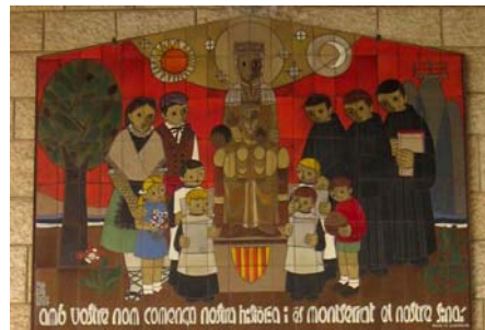
Sopra: rappresentazione della Madonna nel portico della Basilica dell'Annunciazione donata dalla Spagna.

Con questa iniziativa l'Ente compie un altro passo nel suo coinvolgimento con la Terra Santa ed il suo popolo, iniziato già nel 2006 quando si è impegnato nella realizzazione di una nuova scuola a Gericho, consegnando il contributo direttamente a S.E. Padre Pizzaballa, Custode di Terra Santa, in occasio-