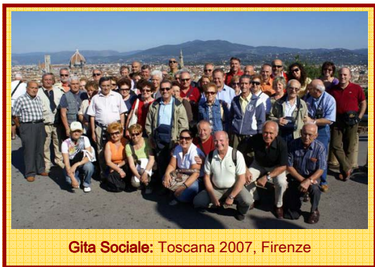
Gita Sociale: Toscana 2007, Firenze