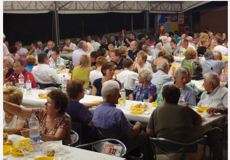
Agosto 2013, la tradizionale cena di pesce per Soci e famiglie