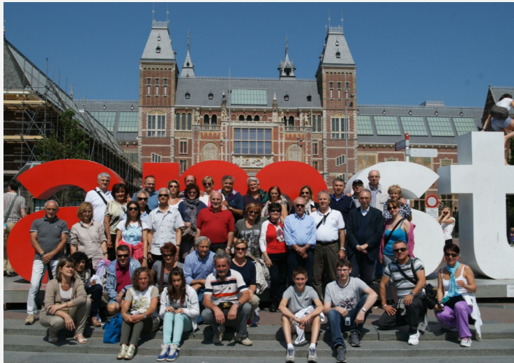
Gita sociale 2013 ad Amsterdam