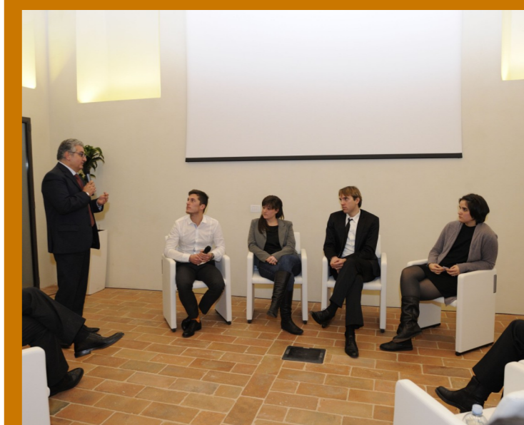
La prima Convention del Fondo per l'eccellenza sammarinese: i giovani sostenuti con la prima edizione del Fondo hanno presentato una breve lezione sul proprio ambito di studi ed hanno risposto a domande e curiosità sulla loro esperienza.