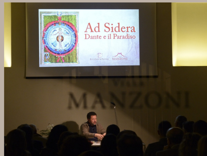
Gli eventi della settimana inaugurale, in senso orario: "Tra il sacro e il profano" - concerto della Corale San Marino; "Ad sidera" - serata dantesca con Franco Nembrini; presentazione del volume di numismatica rinvenuto all'interno della Villa.