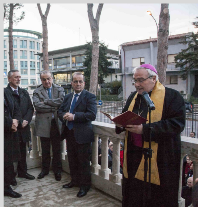
Alcuni momenti dell'inaugurazione: sopra l'ingresso in Villa con le autorità civili e religiose, a sinistra le ricercate esibizioni che hanno arricchito quelle giornate.