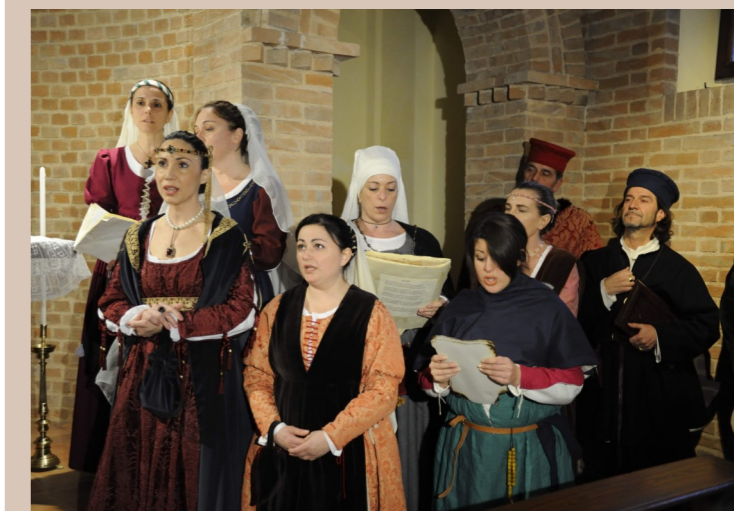
San Marino 1463 - nel 550° anniversario dei Patti di Fossombrone. Sopra: i Fanciulli e la Corte di Olnano accompagnano l'apertura della mostra con un canto medievale. Sotto: il convegno dedicato ai Patti.